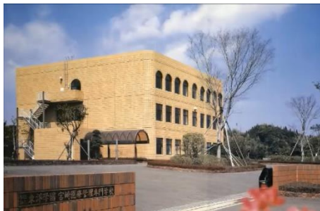
開校当初の校舎は、現校舎の一部のみでスタート