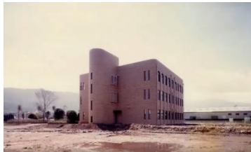
校舎建設開始当初

本校は今年創立四十周年を迎えます。地域の方々や関係機関、学校関係者の皆様に支えられ、約四千八百名の卒業生を輩出してあります。多様な分野で活躍されている卒業生を目標にして、今後も時代が求める医療福祉従事者を養成して参ります。