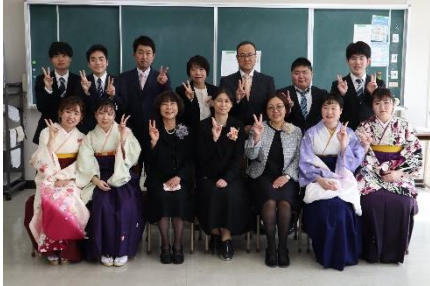
(写真は、介護福祉科第三十二期生の皆さん)

今年の三月に卒業した介護福祉科第三十二期生が受験した介護福祉士国家試験の合格発表が、三月二十五日に行われました。その結果、受験した全員が見事合格しました。(全国の合格率は、72.3%でした。)