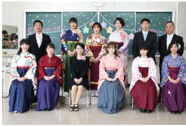
(写真は、医療情報管理専攻科第十五期生の皆さん)

同じく今年の三月に卒業した医療情報管理専攻科第十五期生が受験した診療情報管理士認定試験の合格発表も行われ、本校は合格率90%を達成しました。全国合格率66.7%といつても難しい認定試験でしたが、卒業生の皆さん、よく頑張りました。来年は、合格率100%を目指して専攻科の皆さん、頑張ってくださいましょ。